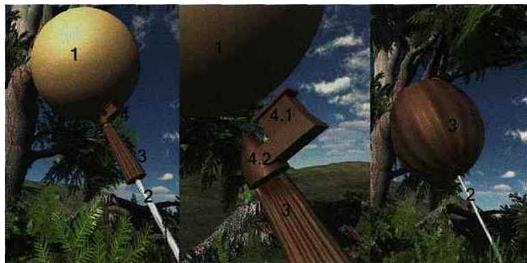
▲ Illustration du principe du four aux micro ondes déployable. Le nid (1) est atteint à l'aide d'une perche télescopique (2) dotée d'une chambre réverbérante déployable (3) et d'une source de micro ondes (4). Les micro ondes sont alors complètement confinées ce qui augmente le rendement et protège l'environnement et les utilisateurs.