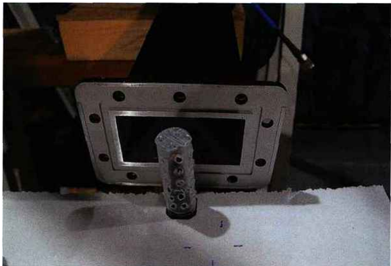
▲ Dispositif de test du niveau de puissance létal : un frelon est placé dans un tube devant l'ouverture d'un guide d'onde servant de source de micro-ondes de puissance ajustable

de frelons vivants pour choisir notre fréquence de travail. Nous mesurons aussi l'absorption du nid pour vérifier que celui-ci n'absorbera pas toute l'énergie. Nous testons le comportement du frelon pour savoir si celui-ci réagit d'une quelconque manière au champ de micro-ondes. Et enfin nous mesurons la puissance nécessaire pour tuer les frelons. Loin de réagir violemment, les expériences sont très encourageantes. Nous parvenons à tuer le frelon en moins