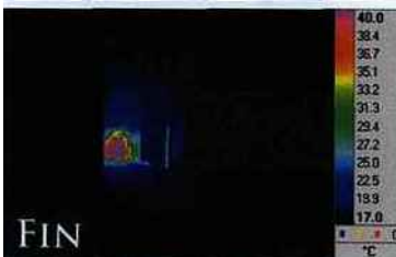
▲ Image de caméra thermique, avant (à gauche) et après (à droite) une exposition d'une seconde à un niveau létal de micro-ondes. On distingue à gauche le frelon en rouge dans un tube accroché à la sortie de la source de micro-ondes (en vert). À droite on remarque que le frelon s'est recroquevillé sur lui-même au moment de sa mort, le contraste plus important témoigne de l'élévation de température