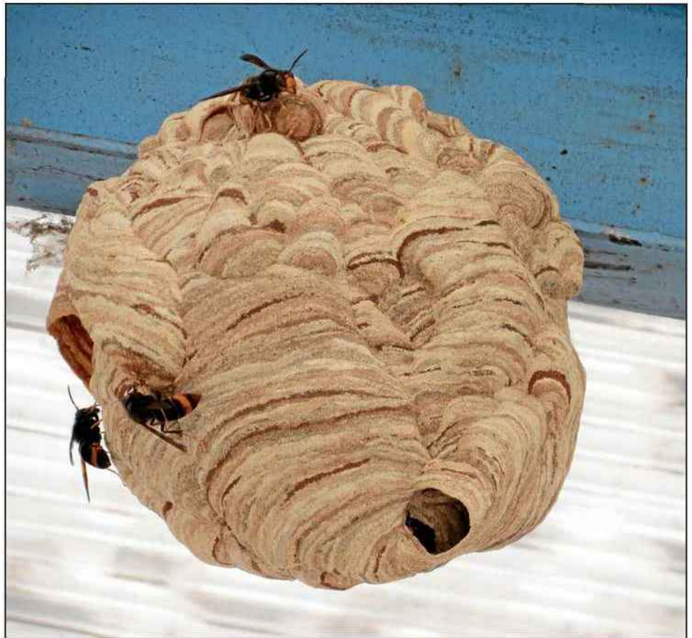
Le nid de frelon asiatique

Dans la ruche, c'est l'émoi : les abeilles savent bien ce qui les attend si elles s'aventurent hors des murs protecteurs de leur abri. Et pourtant, il faut bien aller butiner, pour récolter le pollen nécessaire à nourrir les larves et le nectar essentiel pour produire les réserves de miel qui assureront la survie de la colonie.