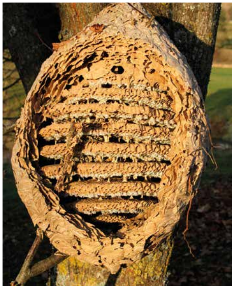
Les nids de frelons asiatiques sont composés d'éléments naturels agglomérés avec la salive des frelons

Avec les pesticides et la monoculture, le frelon asiatique est aujourd'hui considéré comme l'une des causes majeures de la surmortalité des abeilles. Car contrairement aux abeilles asiatiques, les abeilles présentes en France n'ont pas encore mis en place de stratégie de défense efficace contre ses attaques dévastatrices. À ce stade, les apiculteurs n'ont trouvé aucune solution vraiment efficace et écologique pour protéger leurs abeilles.