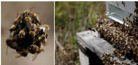
Les abeilles européennes ont développé quelques mécanismes de défense contre les frelons, comme le "thermo-balling" (à gauche) ou le "tapis" (à droite).

Les abeilles asiatiques ( Apis cerana ), elles, ont mis au point des ripostes efficaces : elles forment une boule autour du frelon et produisent une augmentation de chaleur et d'humidité en agitant leurs ailes. C'est la technique dite du "thermo-balling". Mais les études les plus récentes ont montré que la montée en température n'était pas suffisante pour tuer le frelon, même si elle y contribue. En observant comment les abeilles domestiques originaires de Chypre ( Apis mellifera cypria ) tuent le frelon oriental ( Vespa orientalis ), les chercheurs ont remarqué qu'entre 150 et 300 abeilles se regroupent autour de lui et l'asphyxient en bloquant son abdomen. Également présente en Asie, Apis mellifera , l'abeille européenne, a elle aussi mis en place là-bas la technique du thermo-balling mais elle est beaucoup moins efficace qu' Apis cerana .